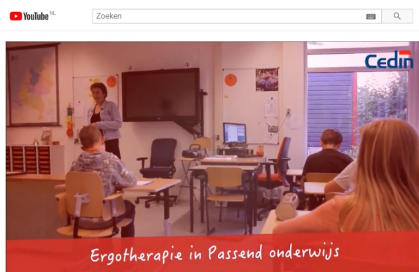
Ergotherapie in Passend Onderwijs - Cedin